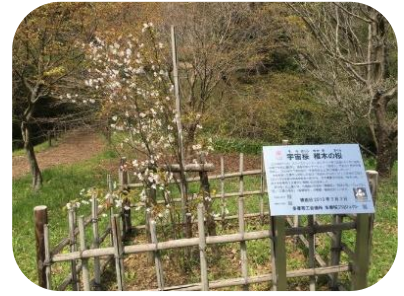
「宇宙桜」(そらざくら)

だいています。都立桜ヶ丘公園には、5種類の宇宙桜・「醍醐桜(岡山県真庭市)・「稚木(ワカキ)の桜(高知県佐川町)・「ひょうたん桜(高知県仁淀川町)・「三春の滝桜(福島県三春町)・「高桑星桜(岐阜県岐阜市)が寄贈・植樹されています。