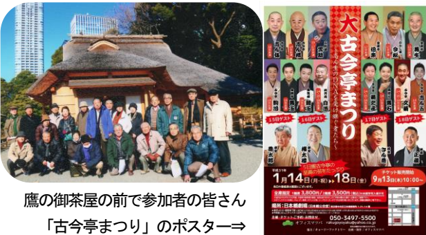
鷹の御茶屋の前で参加者の皆さん 「古今亭まつり」のポスター⇒