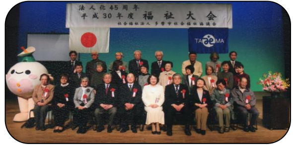
受賞した地域福祉功労者・団体の集合写真