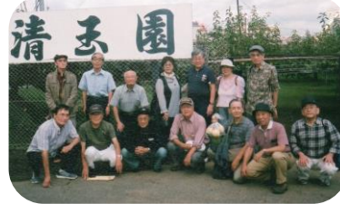
梨狩りに参加の皆さん

9/5 第171回定例会 関戸公民館第2学習室 ◇講話「アイデアマラソンの実行を勧める」アイデアマラソン研究所長(元三井物産(株)ナイジェリア・サウジアラビア・ベトナム・ネパール支店長) 樋口健夫博士 ◇プロバスニュース第80号発行配布 9/9 ホームページ更新 9/14 俳句サークル「苧句会」 9/18 稲城の梨狩りで14名参加 10:30 稲城長沼「清玉園」 「天安よみうりランド店」中華料理の昼食ご解散