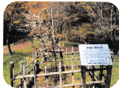
「宇宙桜」(そらざくら)

だいています。都立桜ヶ丘公園には、5種類の宇宙桜・「醍醐桜(岡山県真庭市)・「稚木(ワカキ)の桜(高知県佐川町)・「ひょうたん桜(高知県仁淀川町)・「三春の滝桜(福島県三春町)・「高桑星桜(岐阜県岐阜市)が寄贈・植樹されています。 “とあった。