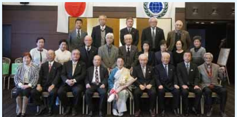
長年のご協力に感謝の意を伝え花束の贈呈がありました。