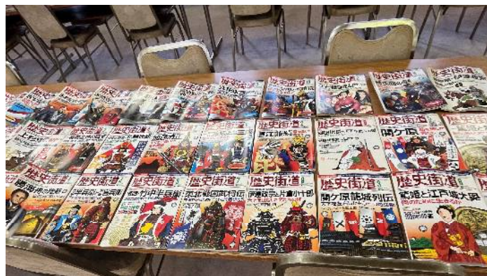
例会場にて展示販売された書籍類