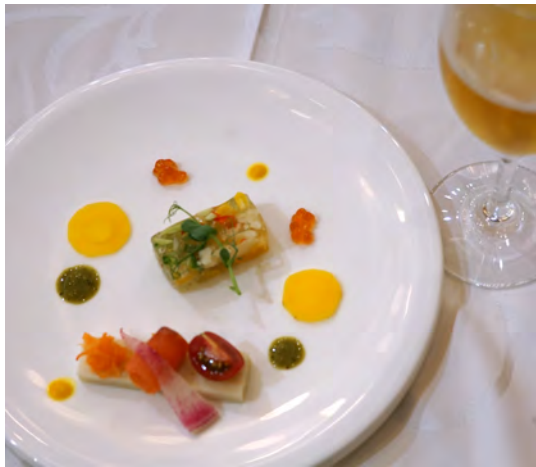
とてもきれいな 食事です