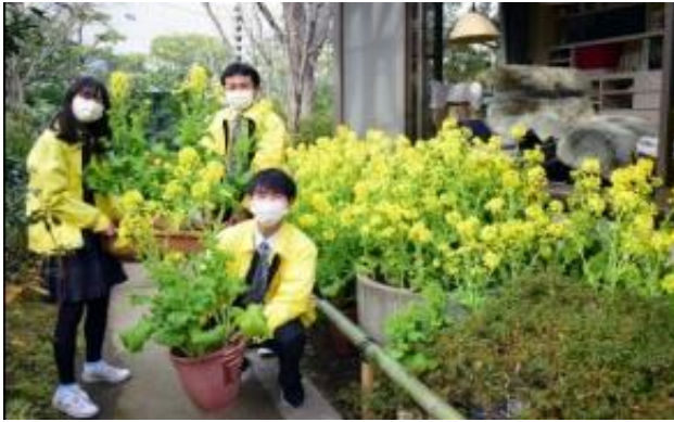
毎年司馬氏の書齋の前に飾られる

山を訪れた時に読んだとされ、それ以外にも多くの菜の花の句を残している。徳川吉宗の享保の改革で、民衆の生活水準が上がり、家の内外のあらゆるところで行灯の油が必要となってきた。そこで水車による機械化で一種の産業革命が起こったとされる。観賞用としても実用としても活用された。